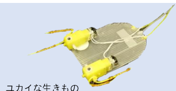
ユカイな生きもの

ロボットの基本をまなび，ユカイな生きものロボットをつくってうごかしてみましよう。